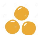
Lupini e prodotto a base di lupini