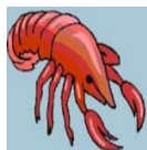
Crostacei e derivati